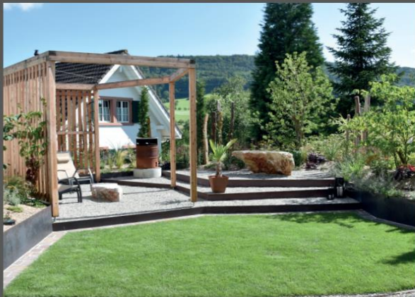
Bild nach Ausführung

Sie wollen sich Raum für Wohlbefinden und Glücksmomente gönnen?