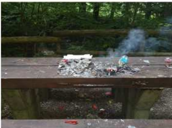
Tischgrill wie es nicht sein sollte

Der Rastplatz beim Schaggibrüggli wurde letzten Herbst von Vandalen ramponiert. Der Tisch wurde als Feuerstelle missbraucht und der Abfallkübel wurde leider auch nicht als solcher erkannt. Zudem hatte auch das Wetter und der Lauf der Zeit etwas an den Einrichtungen genagt, zum Beispiel waren die Sitzgelegenheiten aus Holz nicht mehr schön und stabil.