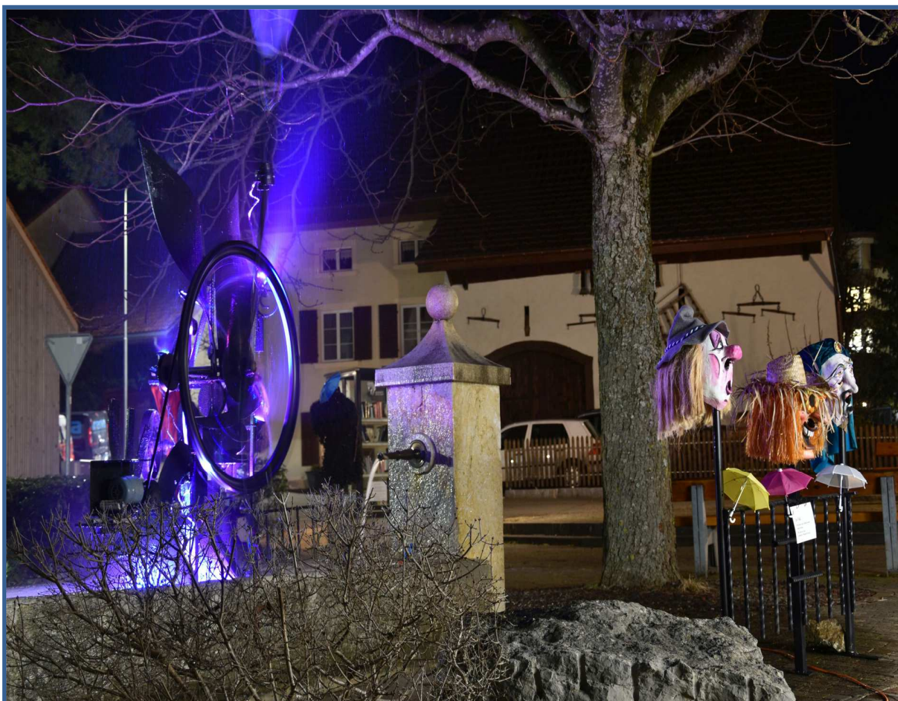
Fasnacht 2021

von 09.00 – 12.00 Uhr und 14.00 – 17.00 Uhr