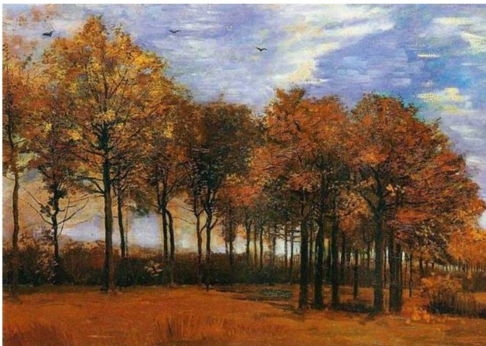
«Herbstlandschaft», Vincent van Gogh, Herbst 1885

Erntedank, Missionsopferwoche, Weihnachtspäckli-Aktion 2020