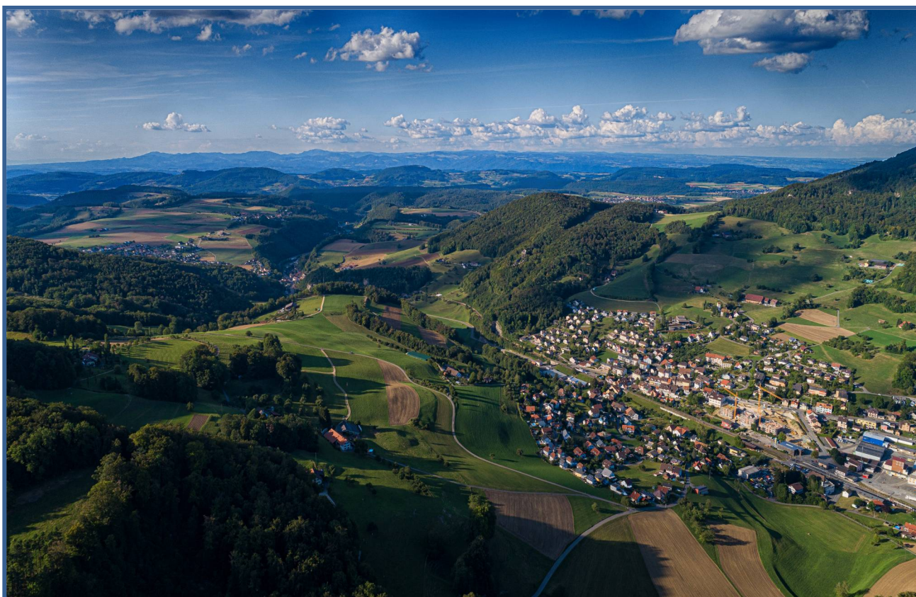
Luftaufnahme Aug. 2020

von 09.00 – 12.00 Uhr und 14.00 – 17.00 Uhr